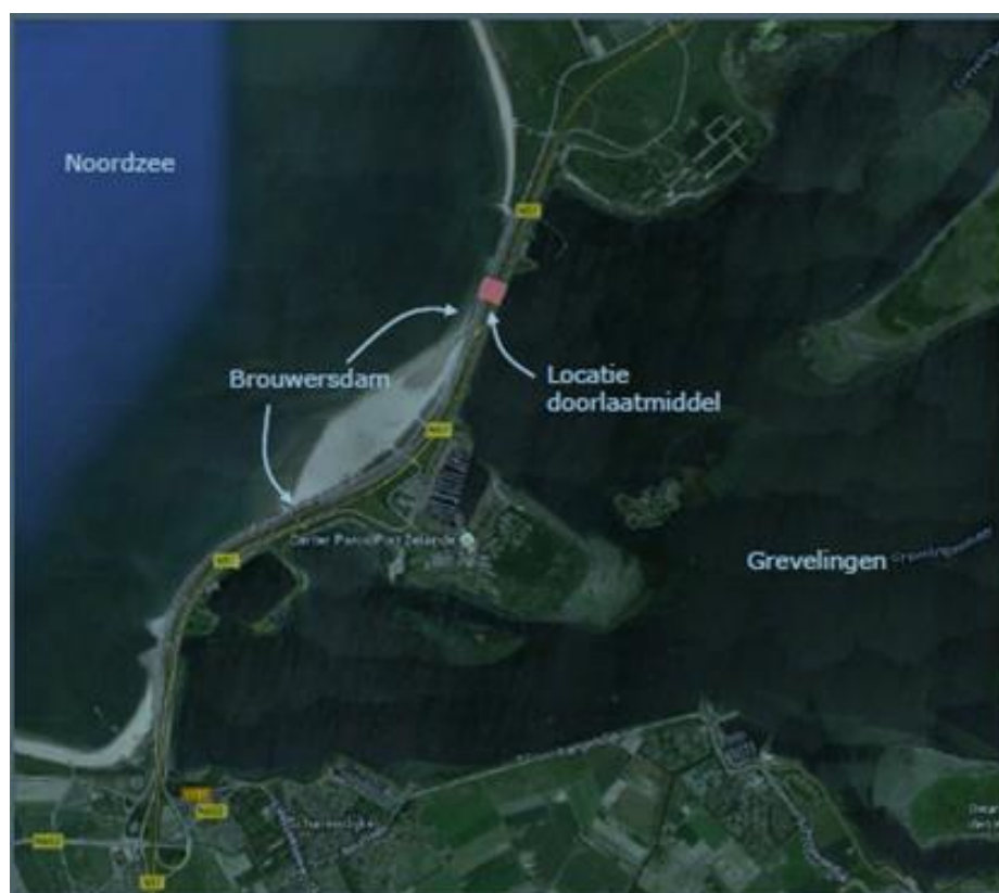
Figuur 1: Locatie doorlaatmiddel in het noordelijk deel van de Brouwersdam